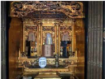
お修理前プレビュー